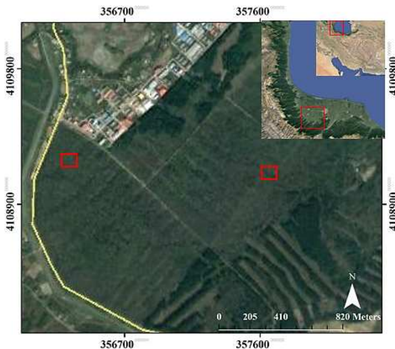
شکل ۱- موقعیت جغرافیایی منطقه مورد مطالعه