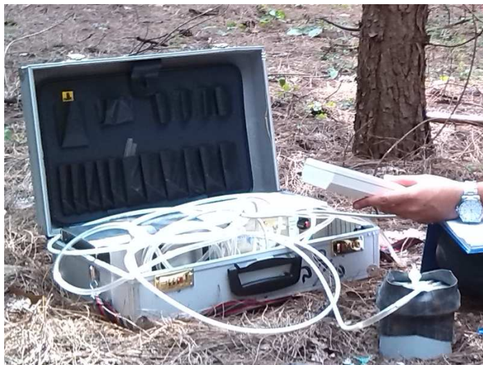
شکل ۲- دستگاه قابل حمل اندازه گیری تنفس خاک (CO 2 -Port) ساخت آلمان