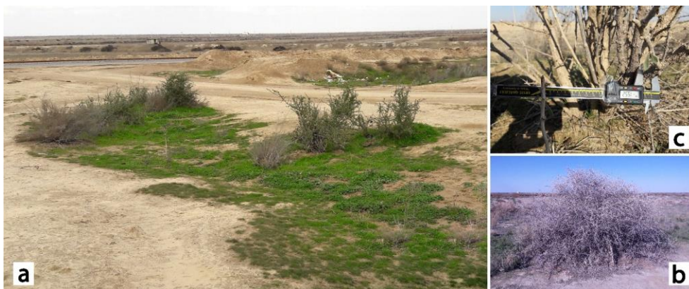
شکل ۱- زیستگاه کام تیغ ( L. depressum Stock. ) در مراتع شهرستان آق قلا. (a) سیمای عمومی یکی از زیستگاه‌های کام تیغ، (b) فرم ظاهری گونه کام تیغ (ارتفاع بین ۱ تا ۲/۵ متر، عرض گیاه: بین ۱ تا ۱/۸ متر)؛ (c) قطر انشعابات اصلی ساقه بین ۱۵ تا ۳۰ میلی‌متر)

نمونه‌برداری و اندازه‌گیری ویژگی‌های خاک: با توجه به هدف مطالعه که مقایسه خصوصیات خاک در پای گونه کام تیغ درون زیستگاه مرتعی آن، خاک بین پایه‌های گونه درون زیستگاه مرتعی آن و خاک خارج زیستگاه در مرتع بود، نمونه‌ها از عمق ۰ تا ۳۰ سانتی‌متری خاک در پای گیاه، بین پایه‌های گونه گیاهی و خارج از زیستگاه به صورت تصادفی با تعداد ۱۰ تکرار از هر تیمار در سال ۱۳۹۷ برداشت شد. در این مطالعه در تعیین زیستگاه از مفهوم عمومی و پذیرفته‌شده آن یعنی "زیستگاه رابط حضور یک گونه با ویژگی‌های مشخص فیزیکی و زیستی از محیط است" استفاده شد که توسط هال و همکاران (Hall et al., 1997) ارائه شد. تمامی پایه‌های گیاهی درون زیستگاه با برجسب در مکان تنه شماره‌گذاری شد. سپس همه پایه‌ها با استفاده از طناب در محل تنه به هم متصل و این طناب‌ها شماره‌گذاری شد. پس از آن، نمونه‌های خاک در پای گونه و همچنین حد فاصل پایه‌ها درون زیستگاه در مکانی که تحت تأثیر تاج پوشش گیاه نبودند به صورت تصادفی برداشت شد. در نمونه‌برداری خارج زیستگاه، ابتدا محقق در مرکز زیستگاه مستقر شد و با انتخاب تصادفی زاویه حرکت خود از ۰ تا ۱۸۰ درجه جهت حرکت را انتخاب کرد. سپس تعداد گام‌ها به صورت تصادفی انتخاب شد و حرکت به خارج زیستگاه صورت گرفت. نمونه‌های خاک در محل فاصله تعیین شده با شمارش گام‌ها به صورت تصادفی برداشت شد (قابل ذکر است که مرتع همجوار زیستگاه از پوشش، شیب و خاک همگنی نیز برخوردار بود).