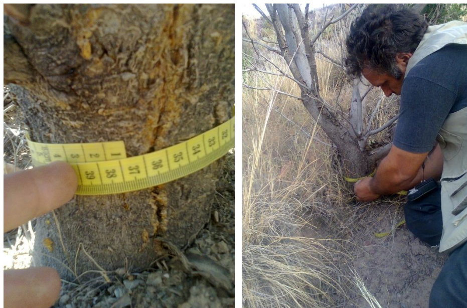
شکل ۲- اندازه‌گیری محیط یقه در بزرگترین درختچه سماق در هر پلات

وضعیت زادآوری به روش کیفی ارزیابی شد. بدین منظور، با توجه به تعداد ریشه جوش یکساله موجود در پلات‌ها در هر پلاتی که ریشه جوش جوان متعلق به سال جاری وجود نداشت از درجه ضعیف، در هر پلاتی که کمتر از پنج عدد باشد از درجه متوسط، در هر پلاتی که از پنج تا ده عدد نهال باشد از درجه خوب و در هر پلاتی که بالاتر از ده عدد ریشه جوش باشد از درجه عالی استفاده شد. برای تعیین شادابی درختچه هم بدین صورت عمل شد که با توجه به وضع ظاهری گونه و وضعیت سلامتی آن برای گونه مورد نظر براساس طول تاج، ساختار تاج و رنگ برگ (پاور و همکاران، ۱۹۹۵) چهار کلاس شادابی در نظر گرفته شد که شامل: