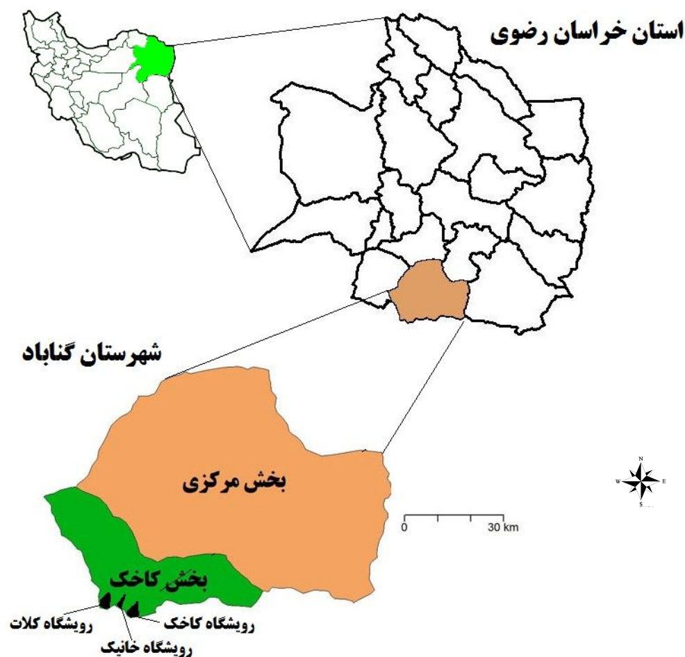
شکل ۱- نقشه منطقه مورد مطالعه و موقعیت آن نسبت به استان و شهرستان

این مطالعه در سه زیرحوزه کلات، خانیک و کاخک صورت گرفت. زیرحوزه کلات با مساحت ۱۷۵ هکتار دارای میانگین بارندگی سالانه ۳۱۳ میلی‌متر در سال و میانگین درجه حرارت سالانه ۱۰/۵ درجه سانتیگراد است. زیرحوزه خانیک با مساحت ۵۲۰ هکتار دارای میانگین بارندگی سالانه ۲۷۱/۲ میلی‌متر در سال و میانگین درجه حرارت سالانه ۱۱/۵ درجه سانتی‌گراد است. زیرحوزه کاخک با مساحت ۵۵ هکتار دارای میانگین بارندگی سالانه ۲۴۳ میلی‌متر در سال و میانگین درجه حرارت سالانه ۱۴/۲ درجه سانتیگراد است. اقلیم هر سه منطقه با استفاده از روش دمارتن نیمه‌خشک و براساس روش آمبرژه خشک سرد تعیین شد (عشقی‌زاده، ۲۰۱۱).