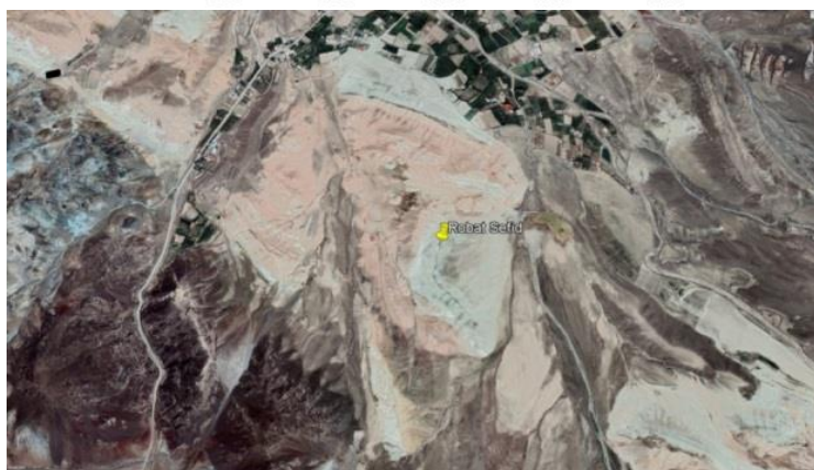
شکل ۱- موقعیت رویشگاه مورد بررسی در منطقه مورد مطالعه