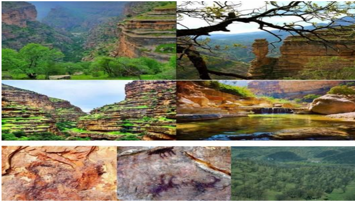
شکل ۲- چشم‌انداز جنگلی و مرتعی تنگه شیرز، پارک جنگلی بلوران و نقوش صخره‌ای هومیان و میرملاس با قابلیت اکوتوریسم