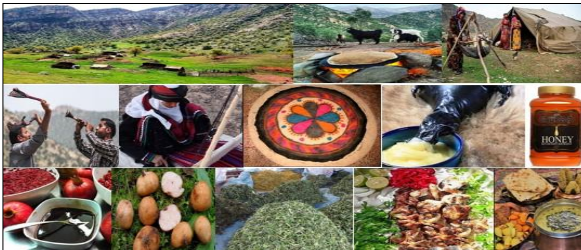
شکل ۳- زندگی عشایری و دام آنان، فرآورده‌های محصولات دامی، روغن حیوانی، عسل طبیعی، بازی‌های محلی، جاجیم‌بافی، نمد، رب انار، قارچ کوهی، سبزی کوهی و غذاهای محلی

نقش خاستگاه چهره‌های ماندگار محلی و خاستگاه تاریخی در گردشگری (۳)، آثار رخدادهای طبیعی از قبیل سیل، زلزله و ... (رتبه ۴)، دسترسی به امکانات محلی موردنیاز نظیر آب شرب سالم، سرویس بهداشتی، پارکینگ، سطل زباله، درمانگاه، اینترنت، راهنما و امکاناتی از این قبیل (رتبه ۵) و فراهم نمودن امکانات اتراق و اسکان موقت از قبیل محل مناسب برای برپایی چادر، سایبان (رتبه ۶) مهم‌ترین آن‌ها بود.