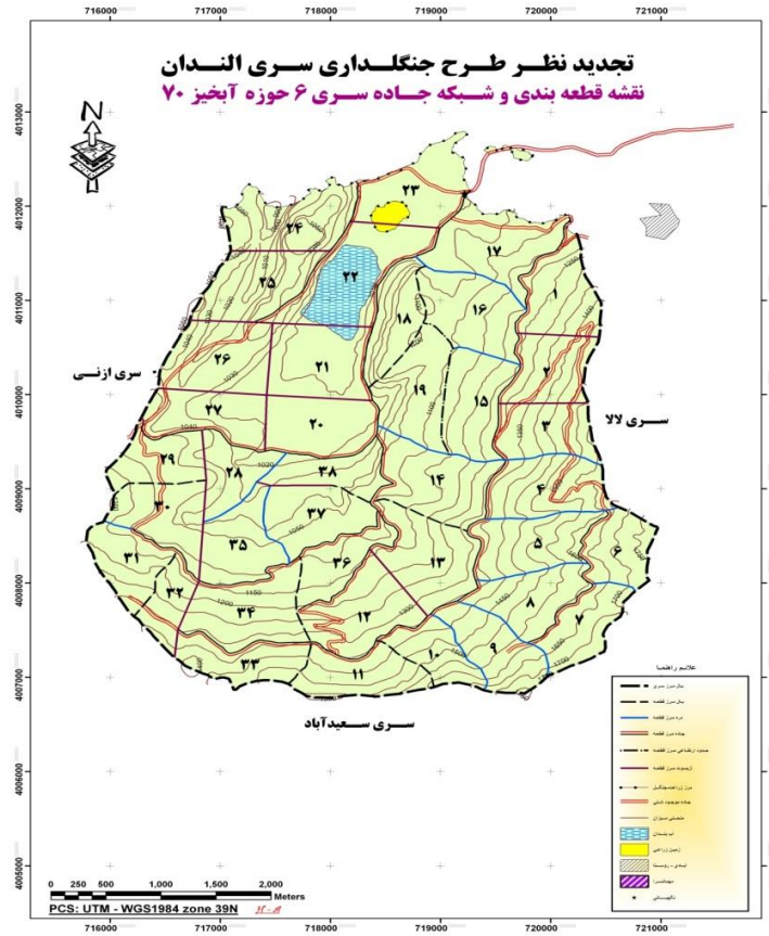
شکل ۱- موقعیت جغرافیایی منطقه مورد مطالعه (استان مازندران جنگل الندان ساری)