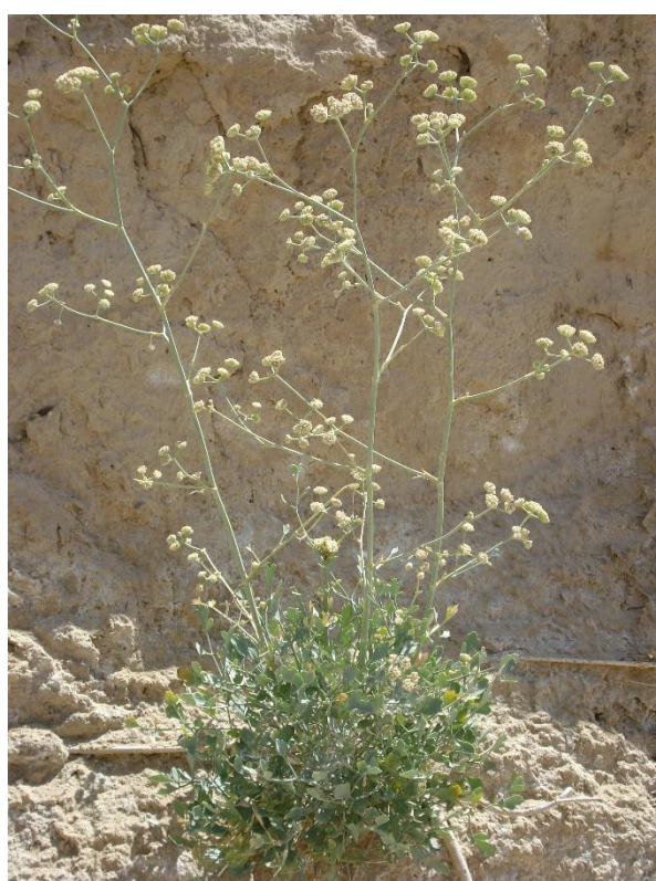
شکل ۱- S. staurophyllum در رویشگاه طبیعی

به‌منظور انتخاب رویشگاه‌های مورد مطالعه، مناطق انتشار S. staurophyllum در استان سمنان براساس فلور ایران