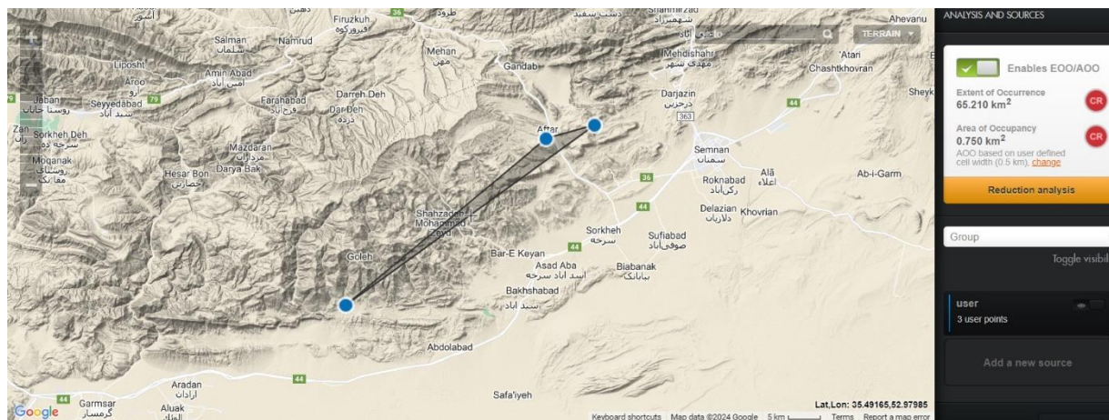
شکل ۴- محدوده حضور و سطح تحت اشغال گونه S. staurophyllum

Ele= Elevation, An.pre= Annual precipitation, An.tem= Annual temperature, Max.tem= Maximum temperature of the hottest month, Min.tem= Minimum temperature of the coldest month, Ab.max= Absolute maximum temperature, Ab.min= Absolute minimum temperature, pH= potential of Hydrogen, EC= Electrical conductivity, OM= Organic matter, N= Nitrogen, P= Phosphorus, K= Potassium, Lime= Calcium oxide, SP= Saturation percentage, San= Sand, Sil= Silt, Cla= Clay, Hei= Height, Can.dia= Canopy diameter, Can.cov= Canopy cover, Le.are= Leaf.area, Bio= Biomass, Ced= Cedrol, epi-Ced= epi -Cedrol, cis-Car= cis -Carveol Hep= 2-Heptanol, Myr= Myrcene, n-Tri= n -Tridecane, Spa= Spathulenol, \alpha -Pin= \alpha -Pinene, \beta -Pin= \beta -Pinene, \alpha -Lon= \alpha -Longipinene, \alpha -San= \alpha -Santalene, \beta -Gur= \beta -Gurjunene, Car= \beta -Caryophyllene, E-Oci= ( E )- \beta -Ocimene, Z-Oci=( Z )- \beta -Ocimene.