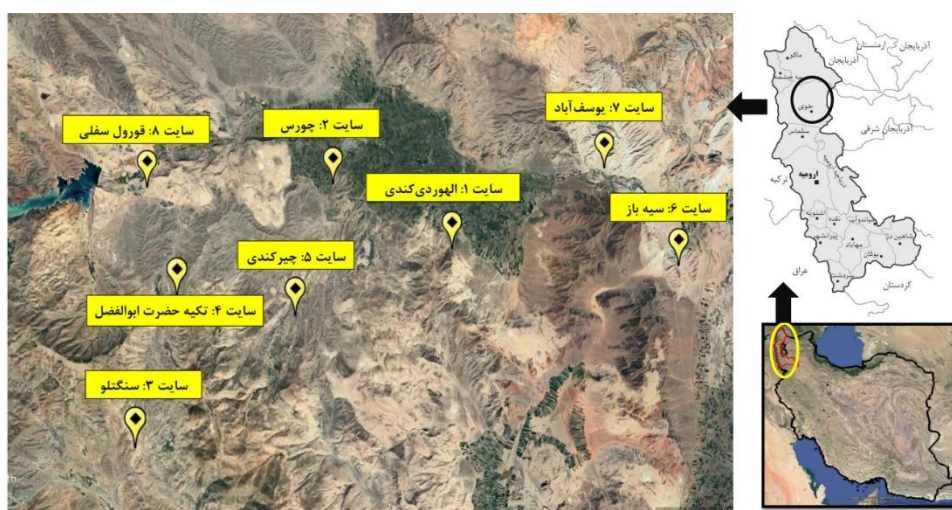
شکل ۱- موقعیت جغرافیایی سایت‌های مرتعی مورد مطالعه

میزان شن و رس با میزان 32/8 درصد در تغییرات پراکندگی گیاهان دارویی نقش دارند. معمایی (۱۳۸۷) در بررسی تاثیر عوامل محیطی بر آشکوب فوقانی در مراتع مشجر سوادکوه دریافت که خاک نقش به‌سزایی در پراکندگی پوشش گیاهی این مناطق ایفا می‌کند. زارع و همکاران (۱۴۰۲) در بررسی تأثیر عوامل محیطی در پیش-بینی رویشگاه گونه Dorema ammoniacum D. DON. در مراتع ندوشن استان یزد نشان دادند که حضور گونه D. ammoniacum D. با درصد رطوبت اشباع و سدیم در عمق اول خاک، کربن آلی در عمق دوم و کلسیم موجود در عمق اول خاک ارتباط مثبت و با نیترات موجود در عمق اول خاک ارتباط منفی دارد. با توجه به مهم بودن برخی از گونه‌های موجود در مراتع از لحاظ دارویی و اقتصادی لازم است تا پژوهش‌هایی برای بررسی شرایط حاکم بر رشد این گونه‌ها انجام شود تا تاثیر عوامل مختلف ادافیکی و توپوگرافی بر رشد آنها مورد ارزیابی قرار بگیرد. بنابراین هدف از انجام این پژوهش بررسی پراکندگی برخی گونه‌های مهم مرتعی تحت تاثیر عوامل ادافیکی و توپوگرافی (مطالعه موردی: مراتع شمال استان آذربایجان غربی) با استفاده از روش رسته‌بندی پوشش گیاهی است. لذا سایت‌هایی برای انجام این پژوهش انتخاب شدند که دارای برخی از گونه‌های مهم هستند و همین‌طور از لحاظ عوامل محیطی با هم دیگر حداکثر تفاوت را دارند.