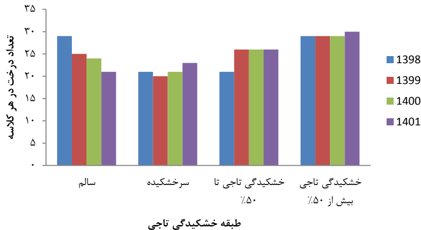
شکل ۴- تغییرات وضعیت کیفی تاج درختان رویشگاه جنوبی در سال‌های ۱۳۹۸ تا ۱۴۰۱

بیشترین تعداد درختان سالم در رویشگاه جنوبی قرار دارد. در رویشگاه شمالی درختان دچار خشکیدگی تاجی بیشتر از رویشگاه جنوبی بود، اما آمار خشکیدگی‌ها بیشتر در کلاسه‌های میانی قرار داشت. در صورتی که در رویشگاه جنوبی بیشتر درختان دچار خشکیدگی تاجی در کلاسه خشکیدگی شدید قرار داشتند. بررسی تغییرات خشکیدگی تاجی نشان داد که در رویشگاه شمالی درصد بیشتری از درختان از کلاسه سالم خارج شدند و مجموع درصد تغییرات ورود درختان به کلاسه‌های خشکیدگی در رویشگاه شمالی بیشتر از جنوبی بود (جدول ۱).