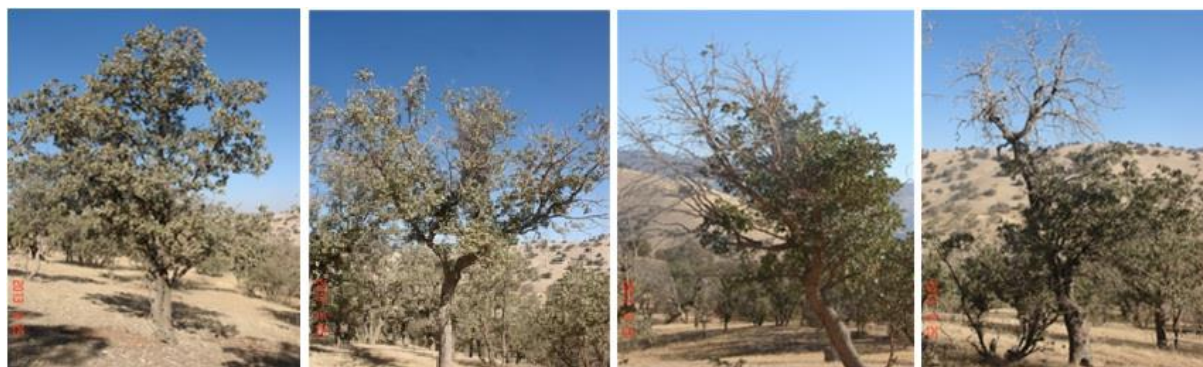
شکل ۲- نمایی از درختان بلوط ایرانی با کلاسه‌های خشکیدگی تاجی سالم تا خشکیدگی بیش از ۵۰ درصد به ترتیب از راست به چپ

دیده می‌شود، اما میزان این خشکیدگی کمتر از ۵۰ درصد تاج را تشکیل می‌دهد. در کلاسه چهارم، خشکیدگی به مقدار خیلی بیشتر از کلاسه‌های قبلی در تاج درختان دیده می‌شود و معمولاً بیش از ۵۰ درصد تاج درخت را شامل می‌شود. ارزیابی وضعیت خشکیدگی تاجی درختان هر ساله در فصل تابستان و در شهریورماه به مدت چهار سال متوالی (سال‌های ۱۳۹۸ - ۱۴۰۱) انجام شد. همچنین در سال اول پژوهش مشخصات فردی هر یک از درختان شامل قطر برابر سینه، ارتفاع درخت، قطر بزرگ و کوچک تاج و منشأ درخت اندازه‌گیری و تعیین شد. در خصوص تعیین منشأ درختان یادآور می‌شود که درختانی که به‌صورت تک‌پایه بودند، به عنوان دانه‌زاد در نظر گرفته شد و درختانی که حالت چندپایه داشتند و پایه‌ها از سطح زمین خارج شده و یا منشعب شده بودند، به‌عنوان جست‌گروه یا شاخه‌زاد در نظر گرفته شدند. افزون بر این تراکم توده از طریق شمارش درختان در قطعات نمونه یک هکتاری در هر رویشگاه برآورد شد.