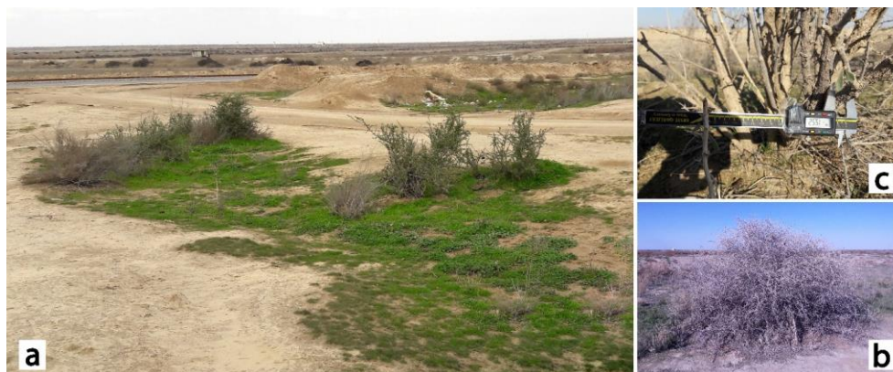
شکل ۱- زیستگاه کام تیغ ( L. depressum Stock ) در مراتع شهرستان آق قلا. (a) سیمای عمومی یکی از زیستگاه‌های کام تیغ، (b) فرم ظاهری گونه کام تیغ (ارتفاع بین ۱ تا ۲/۵ متر، عرض گیاه: بین ۱ تا ۱/۸ متر)؛ (c) قطر انشعابات اصلی ساقه بین ۱۵ تا ۳۰ میلی‌متر)

نمونه‌برداری و اندازه‌گیری ویژگی‌های خاک: با توجه به هدف مطالعه که مقایسه خصوصیات خاک در پای گونه کام تیغ درون زیستگاه مرتعی آن، خاک بین پایه‌های گونه درون زیستگاه مرتعی آن و خاک خارج زیستگاه در مرتع بود، نمونه‌ها از عمق ۰ تا ۳۰ سانتی‌متری خاک در پای گیاه، بین پایه‌های گونه گیاهی و خارج از زیستگاه به صورت تصادفی با تعداد ۱۰ تکرار از هر تیمار در سال ۱۳۹۷ برداشت شد. در این مطالعه در تعیین زیستگاه از مفهوم عمومی و پذیرفته‌شده آن یعنی "زیستگاه رابط حضور یک گونه با ویژگی‌های مشخص فیزیکی و زیستی از محیط است" استفاده شد که توسط هال و همکاران (Hall et al., 1997) ارائه شد. تمامی پایه‌های گیاهی درون زیستگاه با برچسب در مکان تنه شماره‌گذاری شد. سپس همه پایه‌ها با استفاده از طناب در محل تنه به هم متصل و این طناب‌ها شماره‌گذاری شد. پس از آن، نمونه‌های خاک در پای گونه و همچنین حد فاصل پایه‌ها درون زیستگاه در مکانی که تحت تأثیر تاج‌پوشش گیاه نبودند به صورت تصادفی برداشت شد. در نمونه‌برداری خارج زیستگاه، ابتدا محقق در مرکز زیستگاه مستقر شد و با انتخاب تصادفی زاویه حرکت خود از ۰ تا ۱۸۰ درجه جهت حرکت را انتخاب کرد. سپس تعداد گام‌ها به صورت تصادفی انتخاب شد و حرکت به خارج زیستگاه صورت گرفت. نمونه‌های خاک در محل فاصله تعیین‌شده با شمارش گام‌ها به صورت تصادفی برداشت شد (قابل ذکر است که مرتع همجوار زیستگاه از پوشش، شیب و خاک همگنی نیز برخوردار بود).