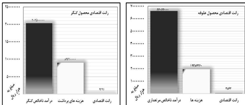
شکل ۲- رانت اقتصادی محصول علوفه تولیدی مراتع و گیاه کنگر در منطقه مورد مطالعه

بر پایه رابطه تعیین مقدار رانت اقتصادی، سود اقتصادی بدست آمده از تولید علوفه یا فعالیت مرتعداری برابر با ۳۸۴۲ هزار ریال در هکتار در سال و منفعت حاصل از برداشت کنگر برابر با ۹۲۹۱ هزار ریال در هکتار در سال بوده است. بنابراین مجموع رانت اقتصادی حاصل از بهره‌برداری علوفه و برداشت گیاه کنگر برابر با ۱۳۱۳۳ هزار ریال در هکتار در سال برآورد گردید (شکل ۲). همچنین بر اساس فرمول تعیین اشتغال سالیانه با احتساب شمار تعداد خانوار و افراد وابسته به دامداران منطقه، میزان اشتغال مستقیم و غیرمستقیم فرآیند مرتعداری در طول یک‌سال به ترتیب ۸۶ و ۲۵۷ شغل (هر ۳۴۹ هکتار یک شغل مستقیم و هر ۱۱۷ هکتار یک شغل غیرمستقیم) و تعداد اشتغال افراد بهره‌بردار محصول کنگر در طول یک‌ماه (۶۰۰ کارگر در روز) به ترتیب ۷۲ و ۲۱۶ شغل (هر ۴۱۷ هکتار یک شغل مستقیم و هر ۱۳۹ هکتار یک شغل غیرمستقیم)، محاسبه شد (شکل ۳).