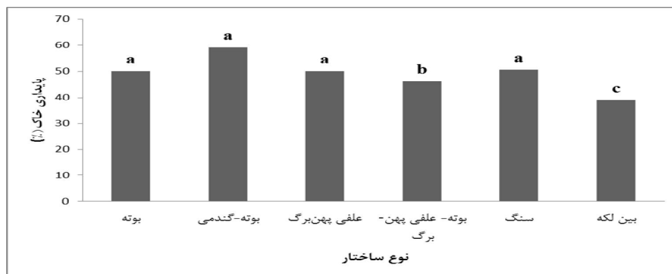
شکل ۱- شاخص پایداری خاک در چشم‌انداز مورد مطالعه بین لکه‌های گیاهی مختلف

** نشان‌دهنده اختلاف معنی‌داری در سطح یک درصد می‌باشد.