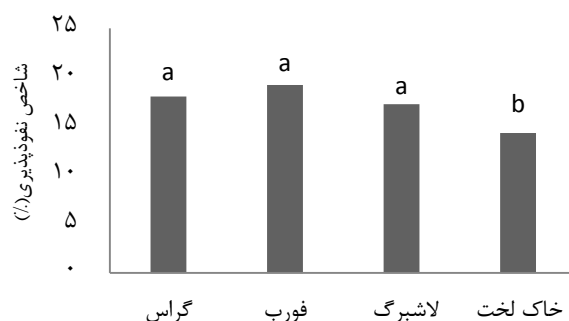
شکل ۲. مقایسه قطعات از نظر ویژگی نفوذپذیری