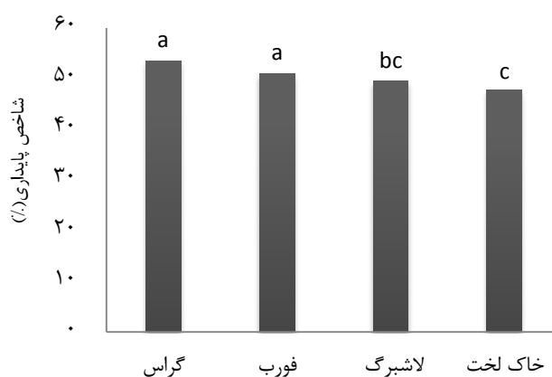
شکل ۱. مقایسه قطعات از نظر ویژگی پایداری

اکولوژیک گندمیان و پهن‌برگان علفی دارد ( P < 0.05 ) (شکل ۱). همچنین مقایسه مقادیر شاخص نفوذپذیری خاک در منطقه نشان داد که بیشترین مقدار شاخص نفوذپذیری به لکه پهن‌برگان علفی (۱۹/۲) تعلق دارد. بین فرم‌های رویشی گندمیان و پهن‌برگان علفی و لاشبرگ اختلاف زیادی دیده نمی‌شود و از نظر آماری این اختلافات معنی‌دار نیست ( P > 0.05 ). خاک لخت دارای کمترین مقدار نفوذپذیری (۱۴/۳ درصد) بوده و تفاوت معنی‌داری را با سایر لکه‌های اکولوژیک نشان می‌دهد ( P < 0.05 ) (شکل ۲). ارزیابی مشخصه چرخه عناصر غذایی نشان داد که لاشبرگ دارای بیشترین مقدار چرخه عناصر غذایی است (۱۲/۹۳ درصد)، بعد از آن پهن‌برگان علفی و گندمیان به ترتیب برابر (۱۲/۵۰ و ۱۲/۲۳ درصد) قرار دارند اما این اختلاف معنی‌دار نیست ( P > 0.05 ). خاک لخت دارای کمترین مقدار شاخص چرخه عناصر غذایی (۸/۴ درصد) بوده و با لکه اکولوژیک لاشبرگ تفاوت معنی‌داری را نشان می‌دهد ( P < 0.05 ) (شکل ۳). نقش قطعات گندمیان و پهن‌برگان علفی در شاخص پایداری و نفوذپذیری بیشتر بوده و نقش لاشبرگ در چرخه عناصر بارزتر است.